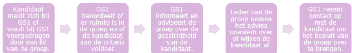
Figuur 2.1: proces nieuwe leden