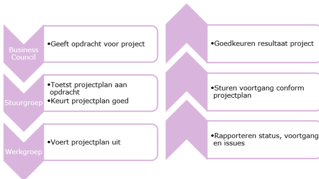
Figuur 1.2: proces voor een nieuw project